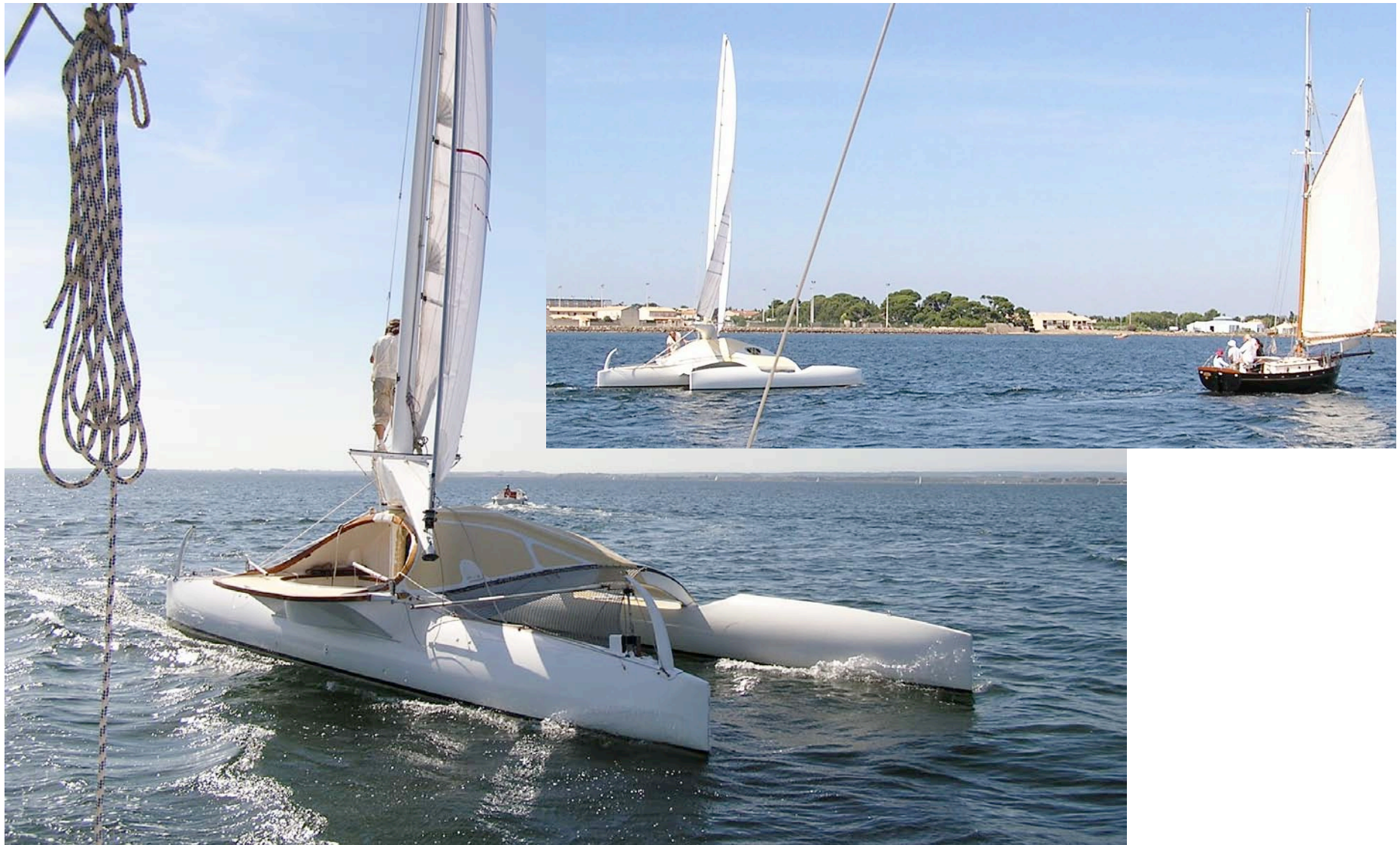
Gréement implanté autoporteur à balestron