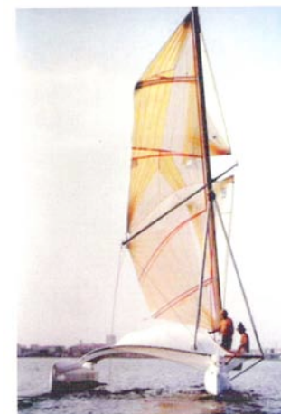
Gréement papillon 32m_